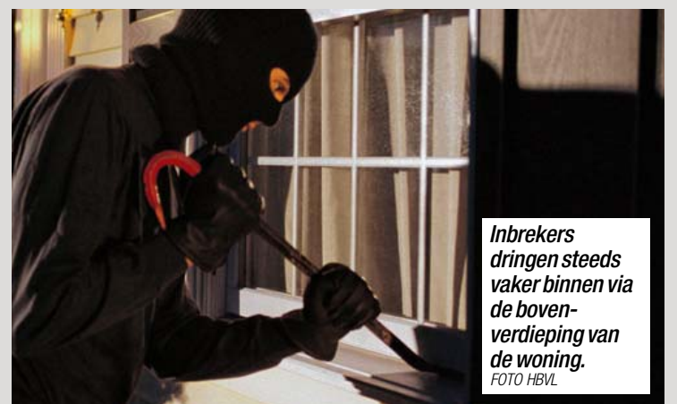
Inbrekers dringen steeds vaker binnen via de bovenverdieping van de woning.

De politie roept bewoners op om waakzamer te zijn in dit verband. Het is helemaal fout om juwelen op de slaapkamer op te bergen, want net daar gaan de daders zoeken. Ze kijken ook altijd in de badkamer. Wie zijn waardevolle sierraden veilig wil opbergen, moet ze dus best verstoppert op een atypische plaats in de woning.